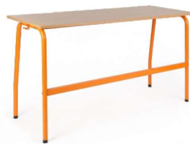
stół olek 2 osobowy