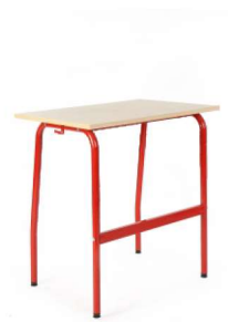
stół olek 1 osobowy