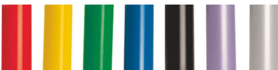
standardowe kolory stelaży metalowych