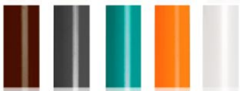
kolor dostępny za dopłatą