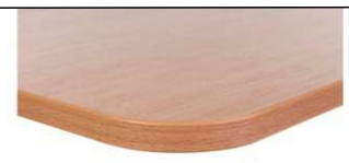
opcja – zaoblone narożniki blatu, okleinowane PCV 2 mm – za dopłatą

zasady doboru stanowiska pracy ucznia w zależności od wzrostu użytkownika