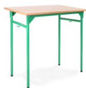
stół żak 1os

Wymiary zgodne z zasadami doboru stanowiska pracy ucznia i normy PN - EN 1729-1: 2007, 1729 - 2:2007 PN - F - 06009 : 2001