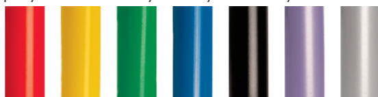
standardowe kolory stelaży metalowych