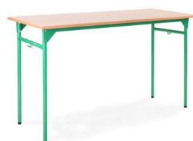
stół żak 2os