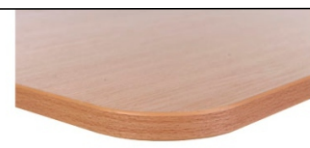
opcja – zaoblone narożniki blatu, okleinowane PCV 2 mm – za dopłatą

zasady doboru stanowiska pracy ucznia w zależności od wzrostu użytkownika