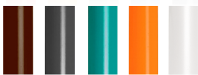
kolor dostępny za dopłatą

Blat z płyty laminowanej dwustronnie w kolorze buk D 381. Obrzeże okleinowane PCV gr. 2 mm w kolorze blatu