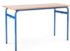
stół bartek 2os